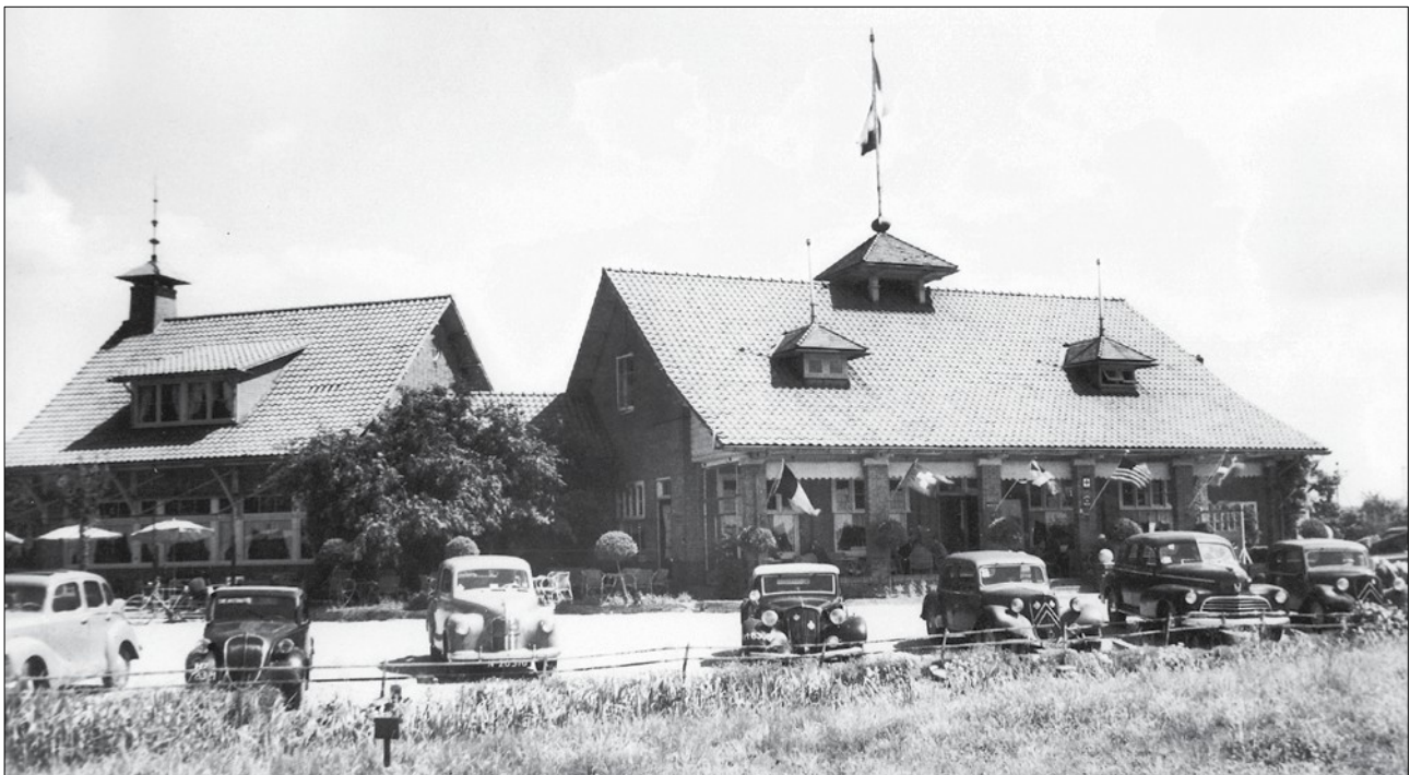
Hotel-restaurant 'Den Boogerd' 1937, gerealiseerd plan aan de rijksweg met eerste uitbreiding.

Niettemin ondervond het dagelijkse leven aanvankelijk weinig hinder van de Duitse bezetting. 'Den Boogerd' genoot in de wijde omtrek een groeiende bekendheid door zijn ligging aan de autoweg bij de oprit naar de nieuwe brug. Het was een markant gebouw met ruime parkeermogelijkheden. Vooral de blijmoedige gastvrijheid