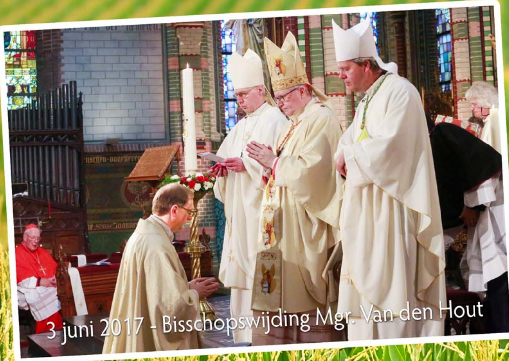
3 juni 2017 - Bisschopswijding Mgr. Van den Hout