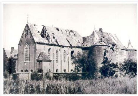
Oorlogsschade aan de kloosterkerk

De kapel zat beide keren stampvol. Zieken en bejaarden lagen op bedden en ruststoelen in het middenpad en op de gangen. De missen