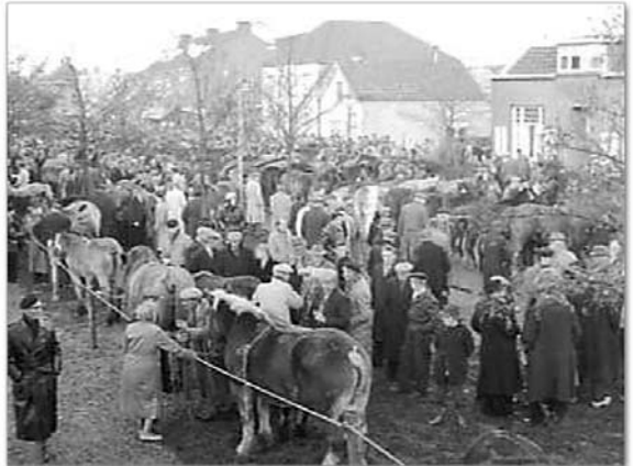
Paardenmarkt 7 november 1960